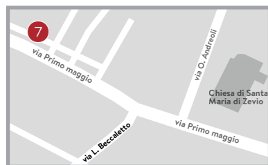
S. MARIA DI ZEVIO